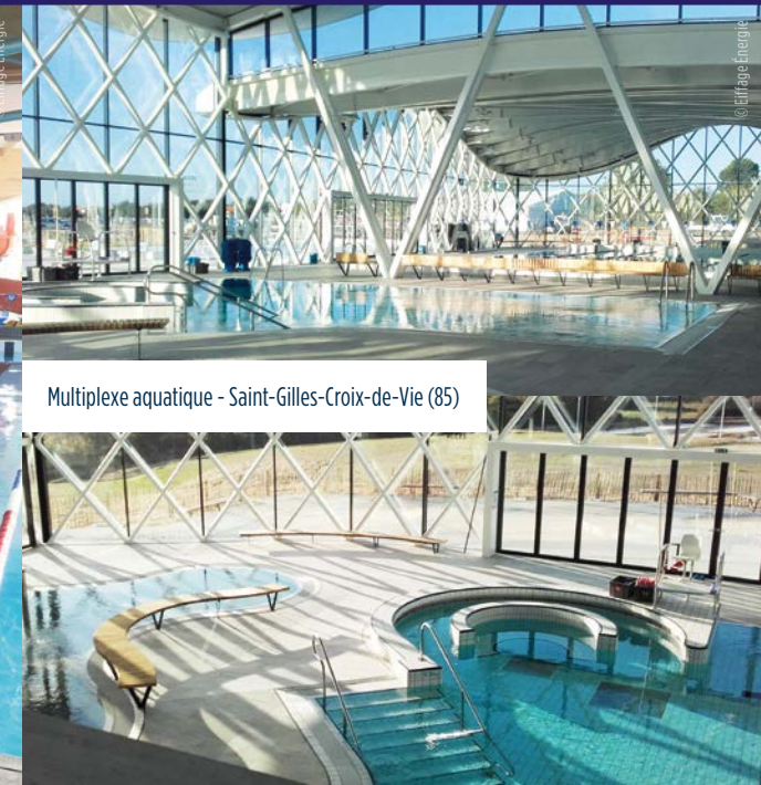
Multiplexe aquatique - Saint-Gilles-Croix-de-Vie (85)