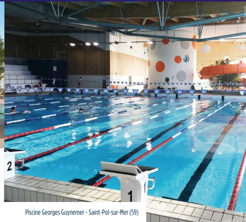
Piscine Georges Guynemer – Saint-Pol-sur-Mer (59)

Bureau d'études technique du groupement Conception Construction : Tual