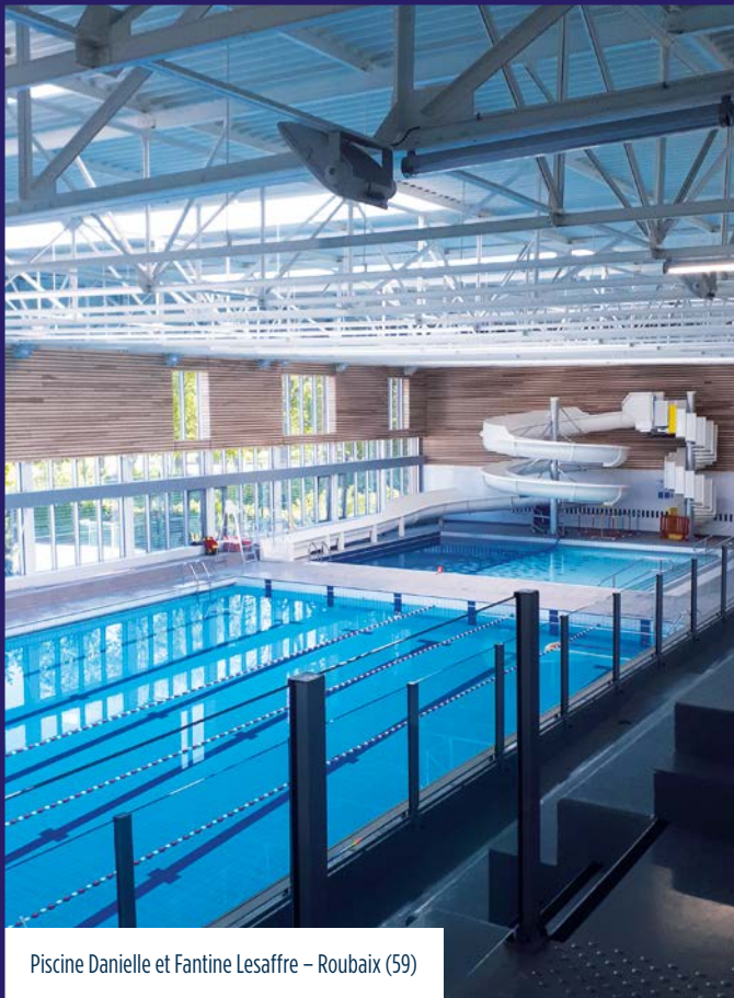
Piscine Danielle et Fantine Lesaffre – Roubaix (59)