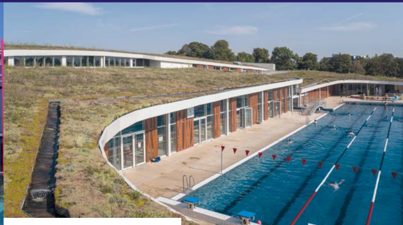
Centre aquatique du Carrousel - Dijon (21)